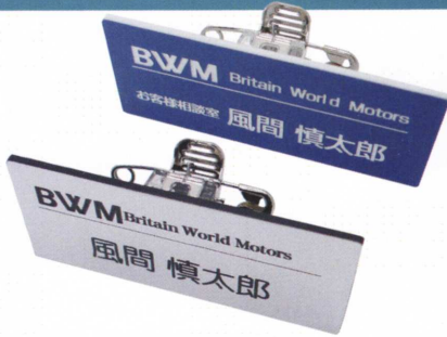
※厚み: 1.5mm ※材質: ABSとアクリルの二層